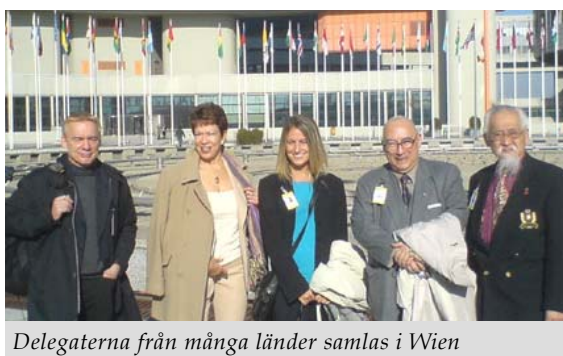
Delegaterna från många länder samlas i Wien