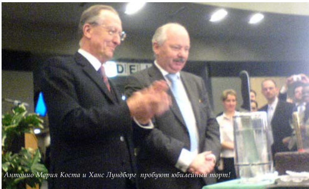
Антонио Мария Коста и Ханс Лундборг пробуют юбилейный торт!

"Мы должны уметь делать два дела одновременно: жевать резинку и ходить" Антонио Мария Коста