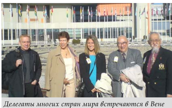
Делегаты многих стран мира встречаются в Вене

Специальной темой 50-й сессии стало улучшение контроля над торговлей прекурсорами. ООН обеспокоена тем, что легальный экспорт химических веществ может легко переходить в незаконное производство наркотиков. Китай является крупным экспортером, а система контроля в стране слабо развита. Члены Евросоюза выступают единым фронтом по этому вопросу и указывают на систему, принятую в ЕС, где предприятия-экспортеры обязаны требовать доказательства того, что принимающая сторона имеет серьезные намерения.