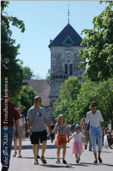
Trondheim kommun leder ECAD:s norske nätverk under perioden 2007-2009

I höstas avslutade Bergen kommun sitt ordförandeskap i ECAD Norge - Nätverket norske byer mot narkotika . Den sista konferensen i Bergens regi genomfördes i oktober 2006 på