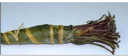
Lūk, tādas izskatās šīs narkotikas

Efekti, kurus izraisa šīs narkotikas ražošana un lietošana ir tikpat nopietni kā jebkuru citu izplatītu narkotisku substanču pārmērīga lietošana.