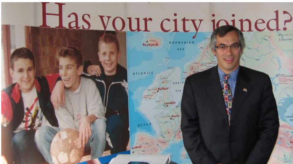
Tony Clement konstaterar att Kanada alltför länge har sänt ut felaktiga budskap om användning av narkotika och att det är dags att inta en mer bestämd hållning för att ta itu med problemet. Bild: Tony Clement på besök hos ECAD, september 2006

Kanadas premiärminister Stephen Harper offentliggjorde den 4 oktober Kanadas nya nationella strategi mot narkotika.