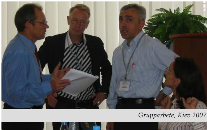
Grupparbete, Kiev 2007