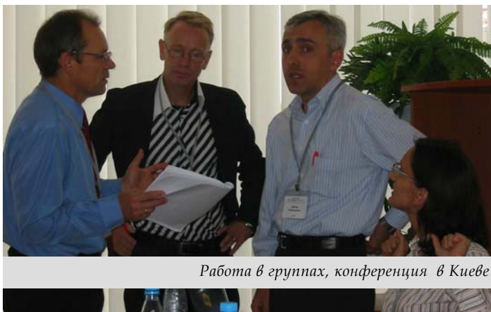
Работа в группах, конференция в Киеве

Подробнее о порядке дня и планируемых мероприятиях в рамках ECAD – на нашей странице в Интернете www.ecad.net