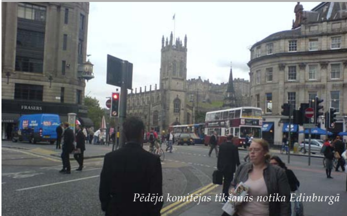
Pēdēja komitejas tikšanās notika Edinburgā

... uzsvēta lielā loma, kāda ir Zviedrijas nevalstiskajām organizācijām, veidojot un attīstot Zviedrijas ierobežojošo narkopolitiku.