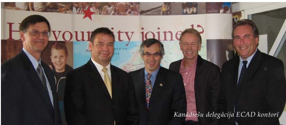
Kanādiešu delegācija ECAD kontorī

Vizītes laikā Zviedrijā 2006.gada 24.augustā Kanādas veselības aizsardzības ministrs apmeklēja valdības komiteju "Mobilizācija pret narkotikām" un ECAD