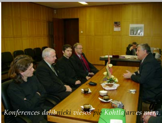
Konferences dalībnieki viesos pie Kohtlajarves mēra.

Centrs piedāvā sociālu, medicīnisku vai juridisku palīdzību, informē par drošības pasākumiem (piem., drošu seksu). Gada laikā Centra