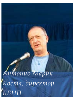
Антонио Мария Коста, директор ББНП

Лаос, который до середины 90-х был третьим крупнейшим производителем опиума в мире, урезал производство до 72% в прошлом году и сейчас превращается в практически безопиумную страну.