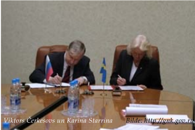
Viktors Čerkesovs un Karina Starrina

29.novembrī Maskavā notika sarunas starp Krievijas Narkotiku aprites kontroles federālā dienesta direktoru Viktoru Čerkesovu un Zviedrijas Karalistes Muitas dienesta ģenerāldirektori Karinu Starrinu