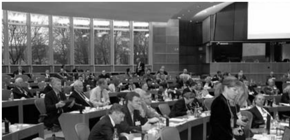
Conferencia en el Parlamento Europeo el 1-2 de marzo del 2005, Bruselas