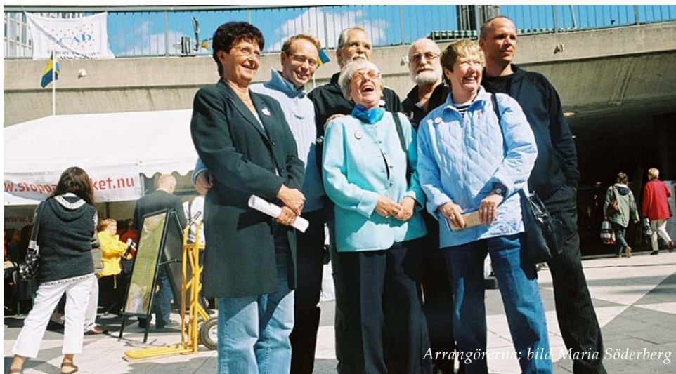
Arrangörerna; bild: Maria Söderberg

Feghet, politisk dumhet och brist på medkänsla står i vägen för att lösa narkotikafrågan och stänga droghandeln kring Sergels torg. Det menar flera organisationer som arrangerade ett 24-timmarsmöte mot narkotika på Sergels torg den 23-24 augusti.