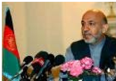
Президент Карзай

На сегодняшний момент, кг героина продается на таджикско-афганской границе по цене 2,5 - 4 доллара, в зависимости от качества. Как только героин достигает Европы, цена уличной продажи взлетает до 250 долларов, согласно статистике Представительства ООН по борьбе с наркотиками и преступностью, UNODC.